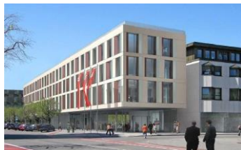
Autohaus Reisacher, Memmingen