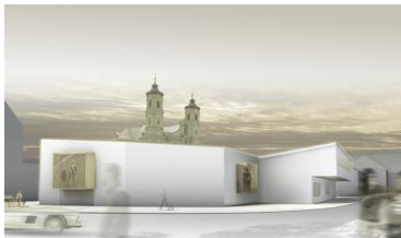
Notker Schule, Memmingen